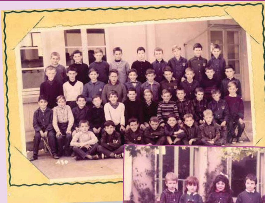
Classe de garçons