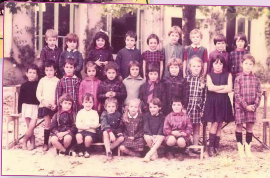
Classe de filles

Classes de 1965/1966. Y reconnaissez-vous des camarades ?